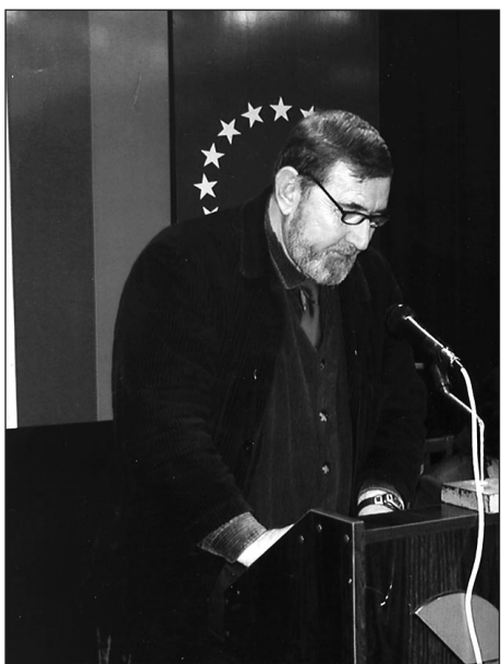
Солова изява, 2006 г.

- Докато беше на този свят, леля Ванга познаваше лично почти всички жители на град Петрич. Наричаха я „калима-