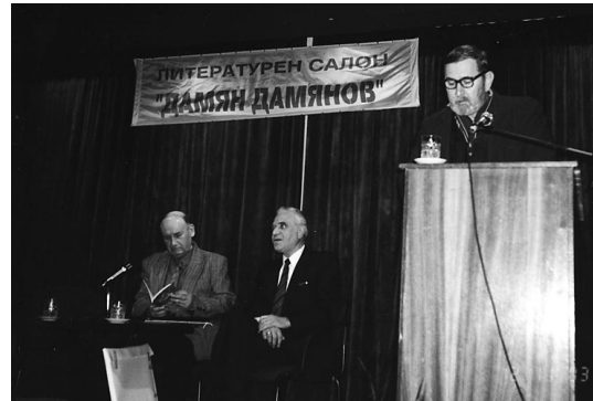
Рецитал на поета в Литературен салон „Дамян Дамянов“ при читалище „Николай Хайтов“, 2006 г.

и не страда с него, той не е поет. Ориста на Поета е да бъде съпричастен с всичко човешко. Да го кори и възпява. Само когато неговият пример е свързан с готовност за саможертва, само тогава хората го възприемат и му вярват. Поетът е духовен водач на съвременниците