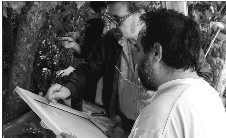
Мелнишки празници на поезията, 2001 г.

- Според мен поетът е любимото дете на Първотвореца - непослушно като Прометей и изкушено от демоничната антисила. Затова от едното око на Поета наднича Ангел, а от другото - Дявол. Поетът е скептичната наивност и усмивката му е винаги с ъглите на огорчението. Поетът се докосва до Познанието, но това му носи само печал, защото разбира колко малко знае и колко огромен и непознаваем е светът, който се побира в душата на Човека. Всъщност бих казал, че Поетът е среда и околност на средата на човечес-