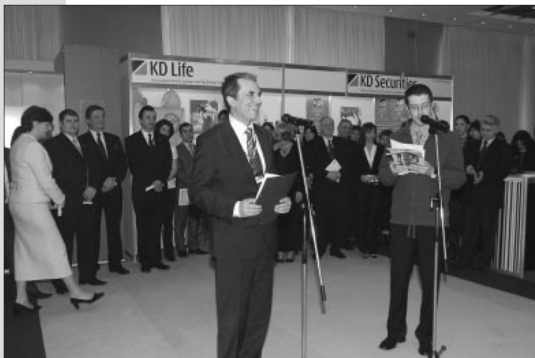
Финансовият министър Пламен Орешарски открива в Пловдив Шестото финансово изложение „Банки Инвестиции Пари“

От 27 до 29 февруари 2008 г. в пловдивския новотел „Пловдив“ под патронажа на министъра на финансите се състоя Шестото международно финансово изложение „Банки Инвестиции Пари“. В рамките на изложението се проведе и международна конференция на тема „Капацитетът на публичния и частния сектор за усвояване на европейските фондове: предизвикателства пред българските общини и финансови институции“, семинари и презентации. Лектори бяха финансисти, министри, представители на финансови институции от Европа, мениджъри и експерти. Форумът бе организиран от „Е-21“ АД - издател на списание „Банки Инвестиции Пари“, с подкрепата на БНБ, КФН, БФБ-София, АИКБ, КРИБ, БСК, БТПП, НСОБ. Сп. „Банки Инвестиции Пари“ съвместно с Българската агенция за инвестиции и МРРБ представи резултатите от проекта „Инвестиционен индекс на общините в България“, чийто патрон е министър-председателят Сергей Станишев . Сертификати на кметовете на отличените общини връчиха на официална церемония Стоян Сталев , изпълнителен директор на БАИ, министри и официални лица. Страна-партньор на изложението бе Кралство Белгия, с любезното съдействие на посолството ѝ в България, а генерален спонсор - „СИБанк“. По време на събитието, което всяка година превръща Пловдив в своеобразна финансова столица на България, за пети път бяха връчени призовите „Финансов продукт на годината“ в няколко категории, Голямата награда „Финансов продукт 2007“, както и приз „Най-добре организиран щанд“ (класация на посетителите).