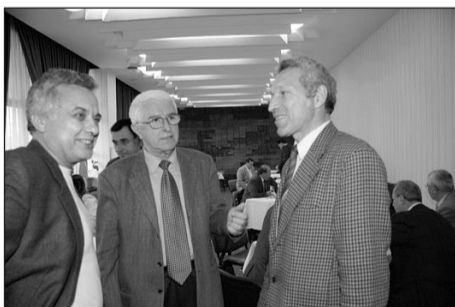
Национална браншова асоциация „Пожарна и аварийна безопасност“.

Към момента съюзът обединява четири сдружения: Национална асоциация на фирми за търговска сигурност и охрана, Национална асоциация на фирми, охраняващи с технически средства, Българска камара за охрана и сигурност и Наци-