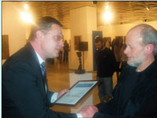
Проф. Ангел Станев (скулптура)