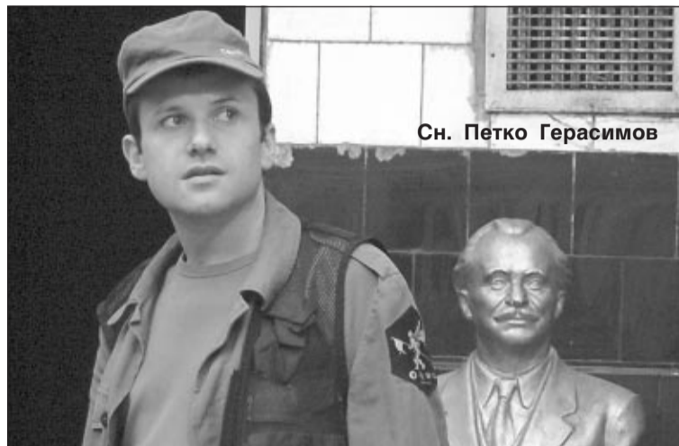
Сн. Петко Герасимов

Достатъчно е един филм да бъде видян от четирима или петима селекционери, и информацията за него мълниеносно се разнася на всички континенти. „Дзифт“ имаше