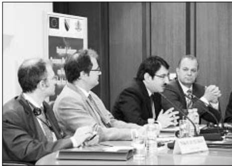
застрахователните пазари и тяхната регулация.

Целта на инициативата бе да представи на участниците от Босна и Херцеговина основните аспекти на застрахователния надзор и регулация в държавите от ЮИЦЕ. В същото време тя се превърна в регионален форум за обсъждане на най-актуалните промени и предизвикателства в областта на