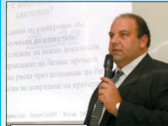
На стр. 20

„Ауто 3П“ представи нови продукти за застрахователния бизнес