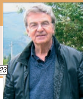
На стр. 23