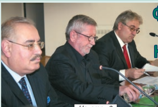
На стр. 2