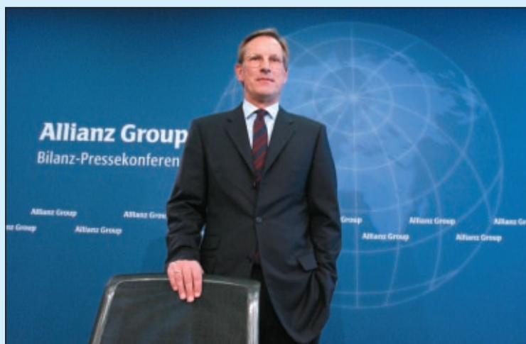
Материалите са ни предоставени от „АЛИАНЦ БЪЛГАРИЯ ХОЛДИНГ“

Силната капиталова база на Allianz дава възможност на компанията да се възползва от тази инвестиция в The Hartford. „Ние вярваме във фундаменталната сила на американската икономика и нейната застрахователна индустрия и уважаваме The Hartford като силна застрахователна марка - каза изпъл-