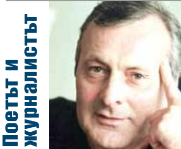
Поетът и журналистът