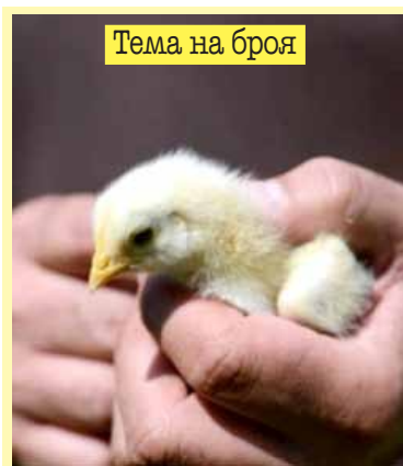
Тема на броя

ВЕТРОВЕ НА ПРОМЯНАТА В ЗЕМЕДЕЛСКОТО ЗАСТРАХОВАНЕ