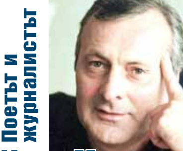
Поетът и журналистът