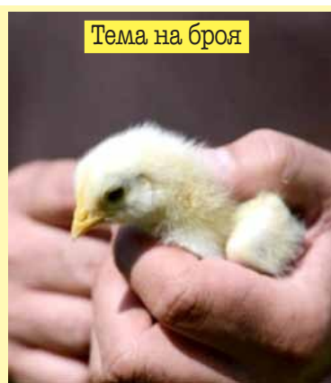
Тема на броя

ВЕТРОВЕ НА ПРОМЯНАТА В ЗЕМЕДЕЛСКОТО ЗАСТРАХОВАНЕ