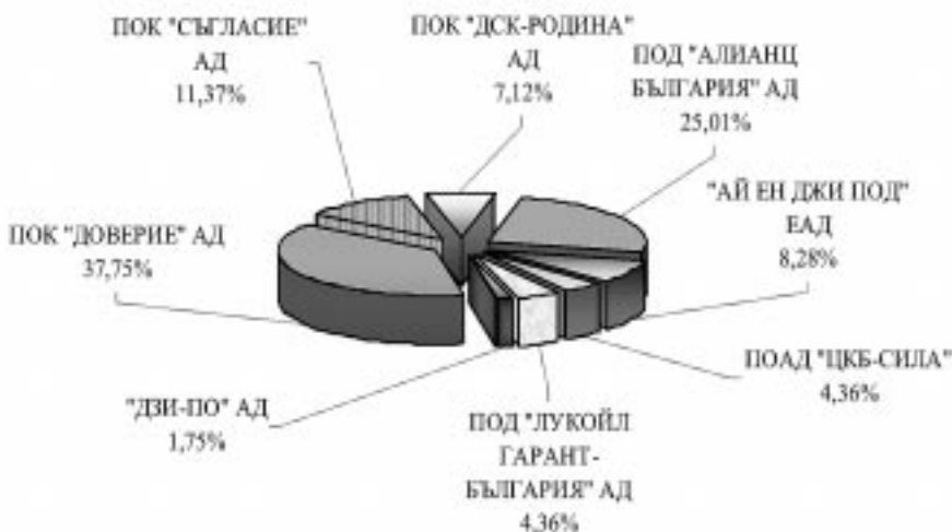
Пазарен дял на пенсионноосигурителните дружества по броя на осигурените лица в управляваните от тях пенсионни фондове към 30.06.2006г.

те средства в ипотечните облигации са на стойност 30 млн.лв., или 6.05 % от инвестициите на всички универсални фондове. Два универсални фонда са направили инвестиции в чужбина, като общата сума възлиза на 10 млн. лева.