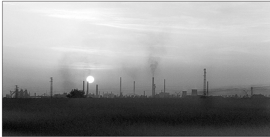
„Пейзаж“ от Кремиковци

са за гаранция може да се използва запорирането на имот на фирмата замърсител, защото внасянето и блокирането на парични средства в банка е най-неблагоприятно и нецелесъобразно за фирмите.