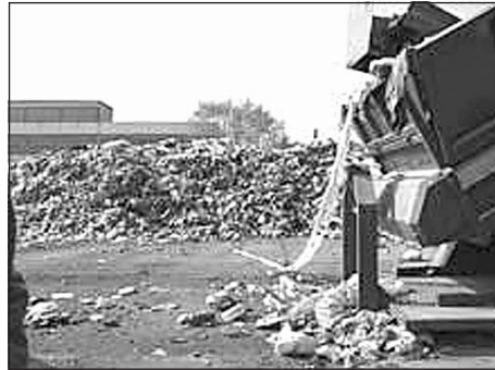
Планини от боклуци

От БСК предлагат следната дефиниция: „непосредствена заплаха за екологични щети“ означава оценена с оглед критериите за оценка на риска достатъчна вероятност за възникване на екологични щети в бъдеще, която да е в пряка причинно-следствена връзка от човешко поведение или човешки фактор“.