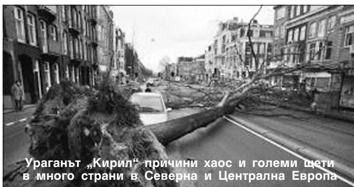
Ураганът „Кирил“ причини хаос и големи щети в много страни в Северна и Централна Европа

Според последни данни в резултат на различни произшествия, предизвикани от урагана „Кирил“ в Европа, са загинали 46 човека, а десетки хиляди пътници не са могли да стигнат до местата, които са възнамерявали да посетят. Практически между всички европейски градове са били нарушени въздухоплавателните и железопътните връзки.