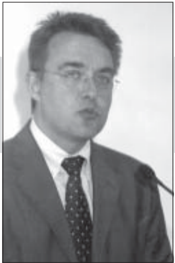
(Продължава от бр. 14)